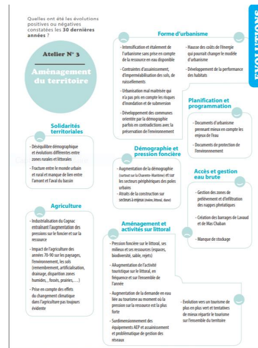
Atelier concertation Charente 2050

Recherche et comparaison des scénarii pour aider à identifier les choix de mesures d'adaptation et les coûts/investissements de celles-ci.